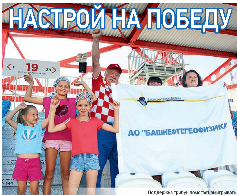
Поддержка трибун помогает выигрывать

24 июня, в Уфе, состоялся третий тур Чемпионата России по футболу среди юношей 2005 г.р. (зона «Урал-Западная Сибирь»). Команда «Алга-Башнефтегеофизика» со счетом 4:1 уверенно обыграла сильного соперника, команду «ВИЗ» из Екатеринбурга.