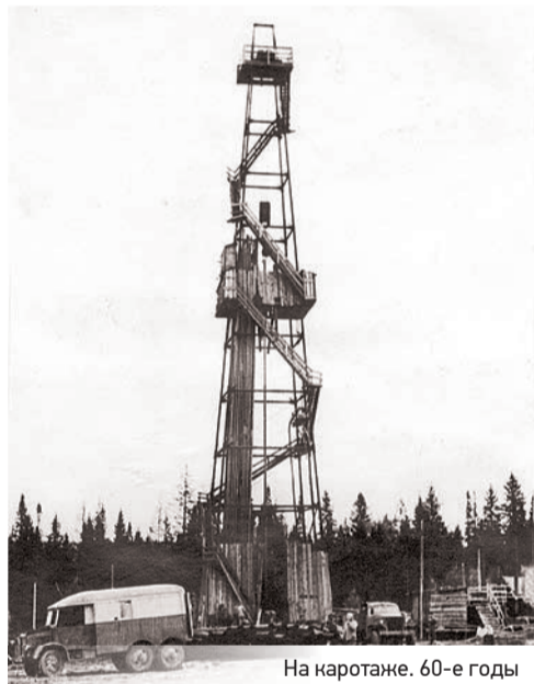
На каротаже. 60-е годы

— Все вместе. Геофизика – глаза и уши нефтяников. Изучение недр, к стати, по стоимости и сложности сопоставимо с полетами в космос. Замечу, что из более чем семи тысяч людей, работающих в нашей компании, более половины – специалисты с высшим образованием, а все руководители структурных подразделений име-