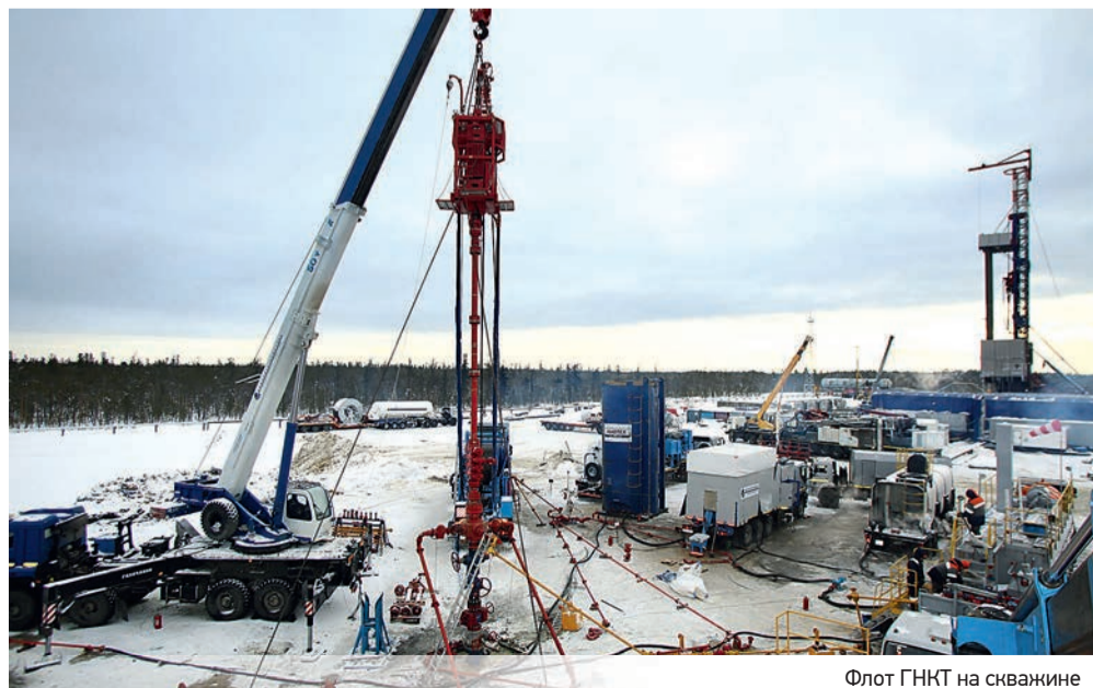
Флот ГНКТ на скважине

Ринат ФАЙЗРАХМАНОВ, газета «Республика Башкортостан»