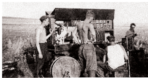
Полевые электроразведочные работы. 50-е годы

Все это способствует творчеству, создает в коллективах атмосферу поиска, открытости и сплоченности. Представительства компании располагаются во всех основных нефтегазодобывающих центрах России: Волго-Уральском регионе, Западной и Восточной Сибири, Ненецком автономном округе. С 1998 по 2013 год, в сложный для нас период, руководству компании удалось провести ряд успешных преобразований, укрепивших потенциал предприятия. Первым таким шагом стало приобретение Таймырской геофизической экспедиции. Были объединены под общим брендом научные,