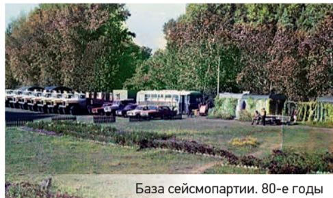
База сейсморазведки. 80-е годы

Сегодня, по оценкам специалистов, компания занимает в стране по объему работ третье место. Она предлагает полный цикл нефтесервисных услуг при поиске, разведке, разработке и эксплуатации месторождений нефти и газа. Разрабатывает и производит геофизическую аппаратуру, в том числе инновационную, и оборудование Hi-Tech класса.