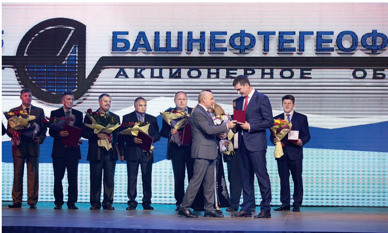
За большой вклад в развитие сферы нефтегазосервисных услуг работникам компании были вручены высокие государственные, отраслевые награды, звания и дипломы