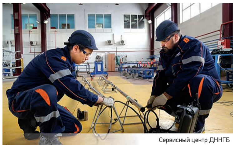
Сервисный центр ДННГБ

У нас развитая профсоюзная организация. В тесном сотрудничестве с ней ежегодно организуем и оплачиваем отдых рабочих и их детей на Черноморском побережье, в лучших санаториях страны. Традиционно с размахом проводятся