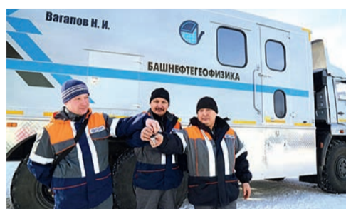
С ключами от нового именного подъемника

— Их много. О географии свидетельствуют наши многолетние заказы – крупнейшие российские нефтяные и газовые компании «Газпром», «Роснефть», «Лукойл», «Башнефть», «Ритэк», «Газпромнефть» и другие. Из 17 наших геофизических партий только шесть работают на территории Башкортостана, остальные разбросаны по всей России. Замечу, каждая партия – это оснащенное по самым современным требованиям подразделение. Стоимость только