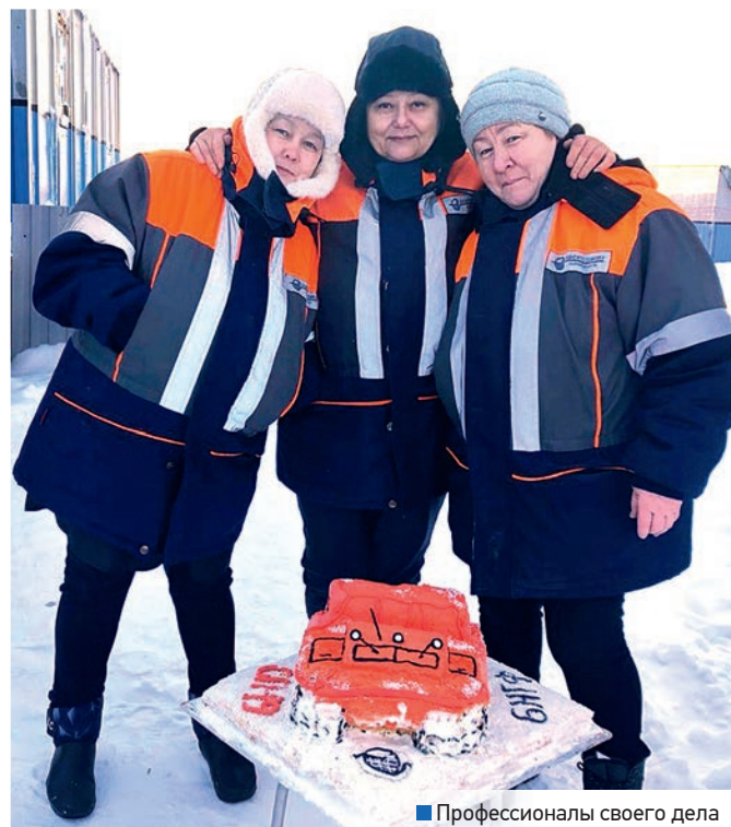
■ Профессионалы своего дела

Всех победителей и призеров отметили грамотами и призами. Поздравляем наших лучших кондитеров с победой и желаем творческого вдохновения и новых кулинарных шедевров!