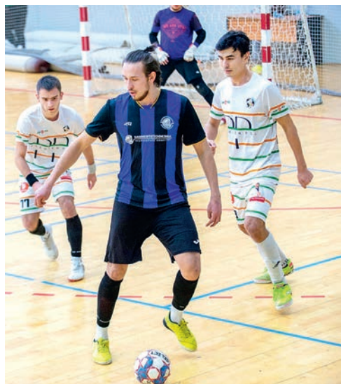
■ Вперед к победе!

В АО «Башнефтегеофизика» корпоративный спорт всегда активно поддерживался на всех уровнях, как со стороны руководства, так и профсоюзного комитета предприятия. Это объясняется просто: спорт способен объединить сотрудников не только общим хобби, но и общими ценностями и интересами, делает их командными игроками не только на спортплощадке, но и в работе. Кстати, спортсмены-любители стараются не подводить болельщиков.